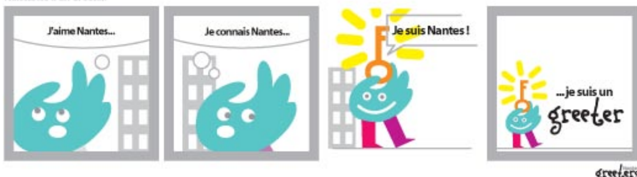
Naissance d'un Greeter.

Les greeters ont en effet la possibilité de devenir « ambassadeurs ». Ils peuvent ainsi participer aux grands événements Nantais de l'intérieur, comprendre les coulisses, proposer leurs idées et les promouvoir, s'en faire un relais d'opinion pour leurs communautés. Une initiative qui a déjà séduit Estuaire 2007, pour la soirée d'ouverture ainsi que la découverte des œuvres le long de la Loire.